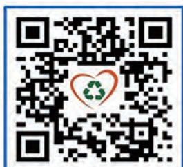
蘋果手機 iOS 下載